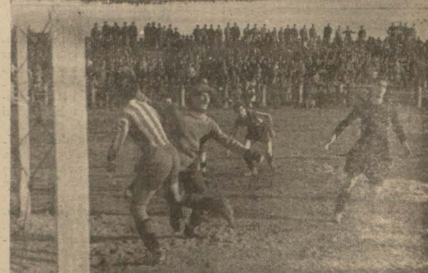
Beşiktaş - Fenerbahçe maçından heyecanlı bir sahne

Galatasaray da İstanbulspor 3 - 1 mağlûb etti, maçlar zevksiz geçti