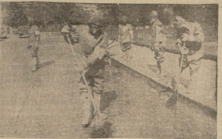
Eminönündeki pasif korunmada caddeler zehirli gazlerle temizlenirken

Üsküdar'da yapılan paraşütlüğe karşı mücadele tecrübesine 250 vatandaş iştirak etti