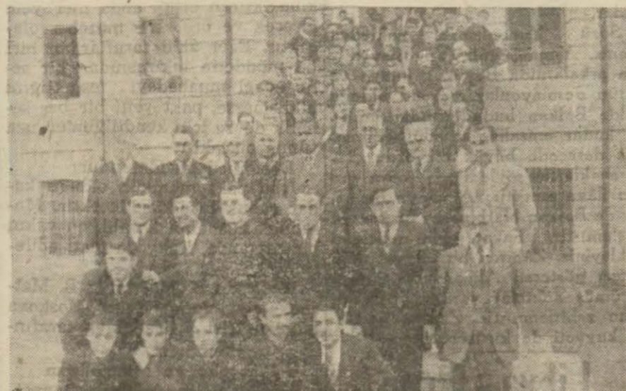
Darüşşafakanın eski ve yeni talebeleri bir arada

Eski mezunlar mektebe aid acı ve tatlı hatıralarını anlattılar ve yeni talebelerle birlikte Darüşşafakanın an'anevi yemeğini neş'e içinde yediler